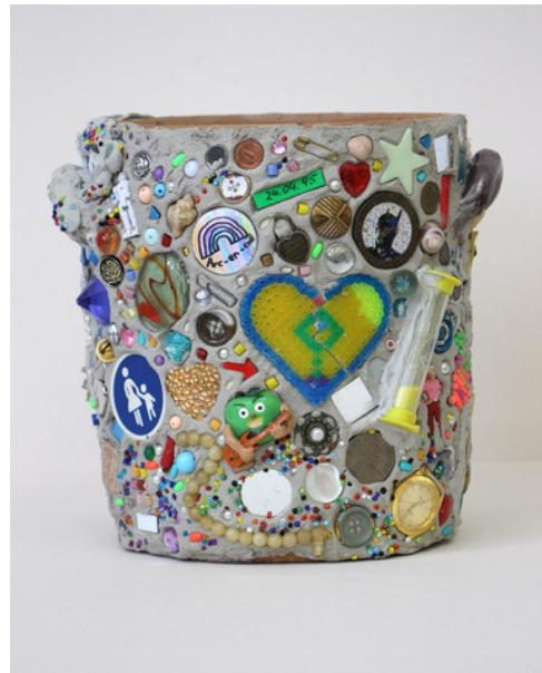
Memory jugs (Käthe Kollwitz), plâtre et objets divers, 32 cm, 2020