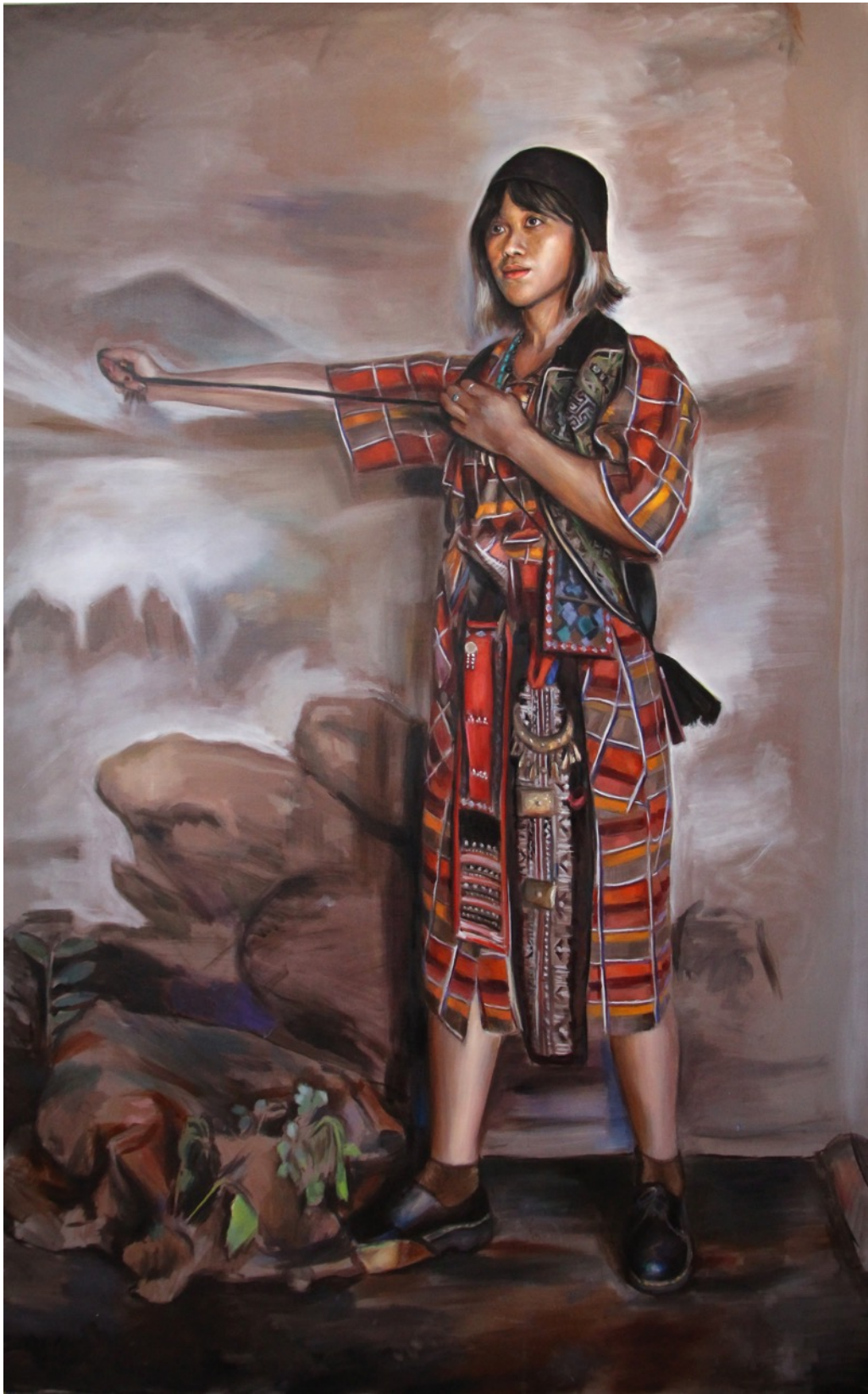
Ya-Hui, huile sur toile, 200 x 125 cm, 2020