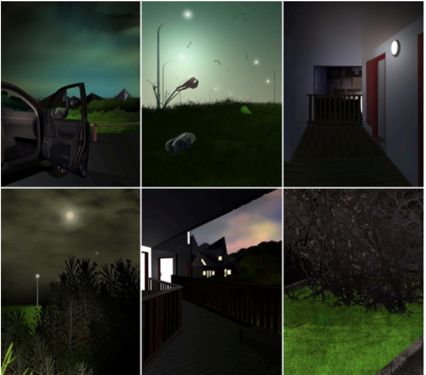
In the Night Garden, 2021, 146,67 x 110 cm Impression diasec Série composée de 6 pièces Edition 1 /3 + 2EA