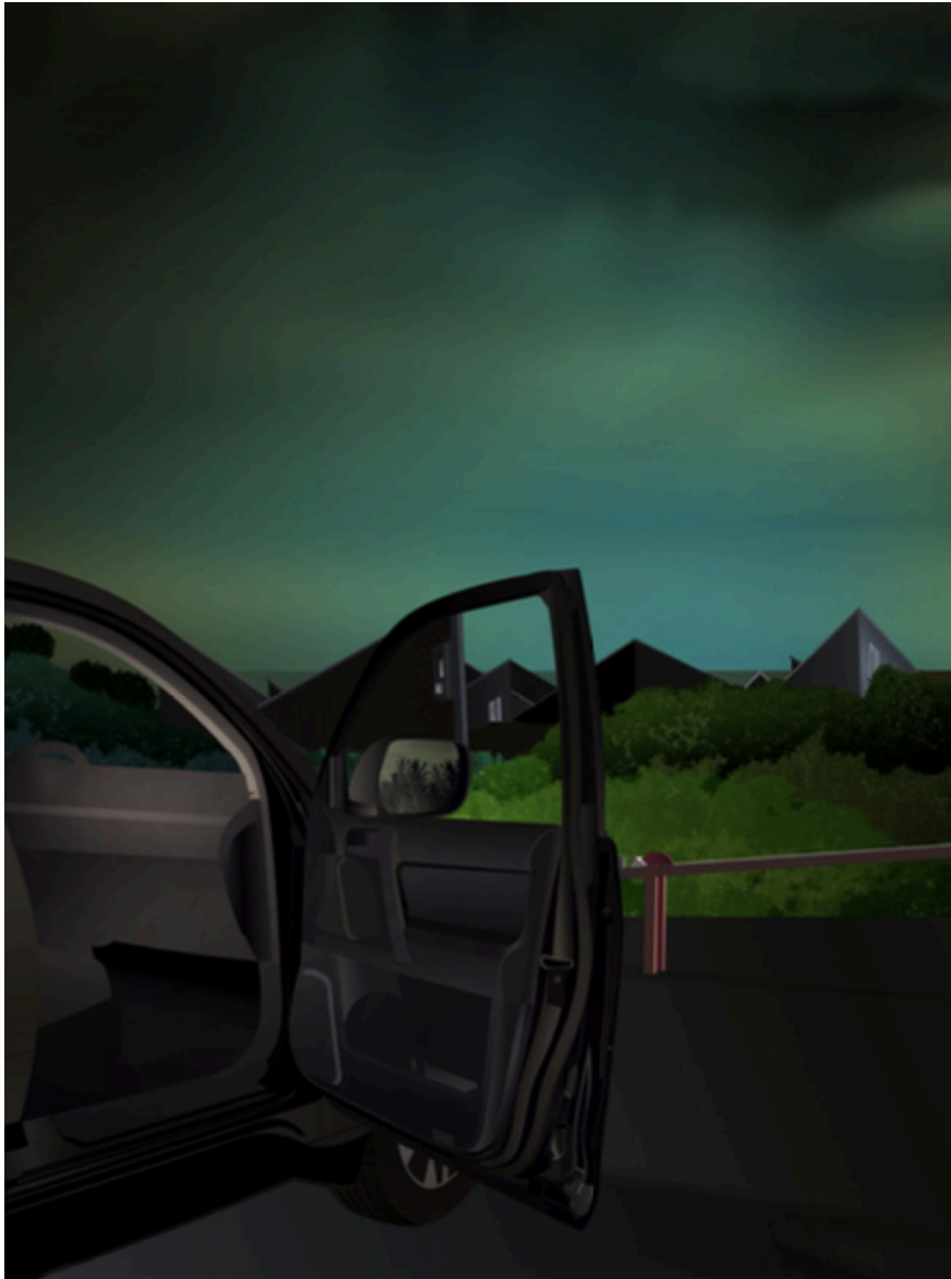
In the Night Garden, 2021, 146,67 x 110 cm Impression diasec Edition 1 /3 + 2EA