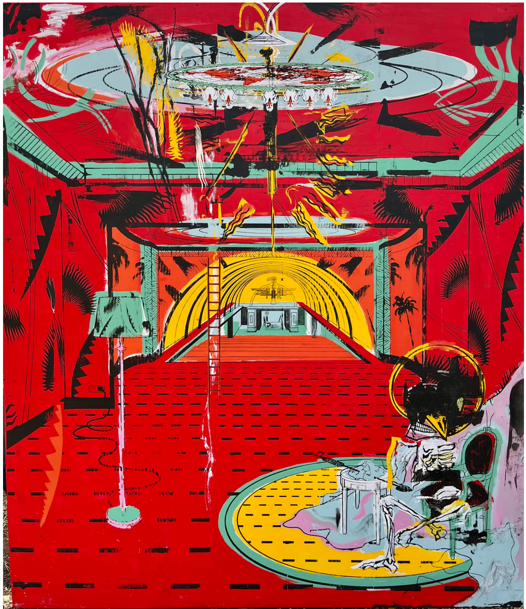
Absorbing War Room , 2023, peinture acrylique, peinture à l'huile et sérigraphie sur toile, 170 x 200 cm