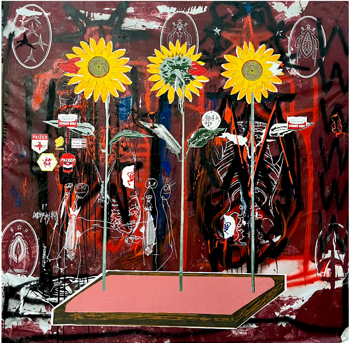
LES TROIS GRÂCES, 2023, peinture à l'huile et sérigraphie sur toile, 190 x 195 cm